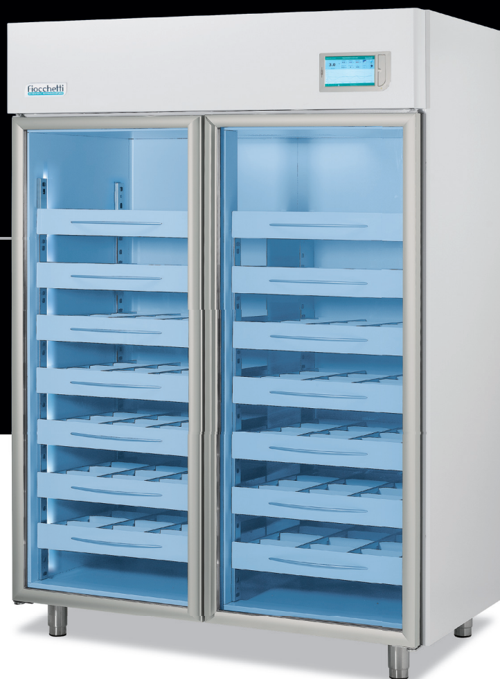
Medika 700 PT